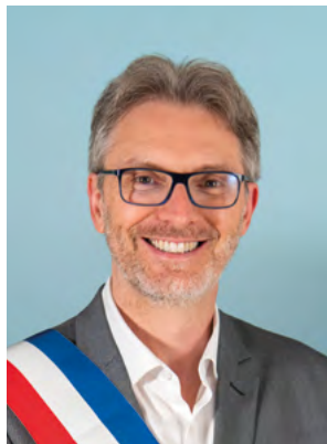
Pascal PELAIN Maire de Villeneuve-la-Garenne Villeneuve, notre ambition !

À l'issue du premier tour du scrutin de l'élection municipale, dimanche 15 mars 2026, la liste « Villeneuve, notre ambition ! » est arrivée en tête des suffrages. Le Conseil municipal du vendredi 20 mars 2026 a élu Pascal Pelain, Maire de Villeneuve-la-Garenne. Les 13 maires-adjoints et l'ensemble des conseillers municipaux ont été élus lors de la séance du Conseil municipal du 20 mars 2026.