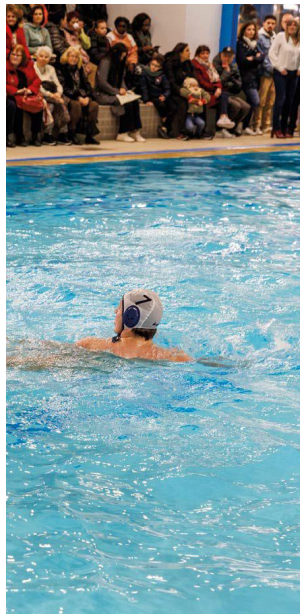
Figure 4 : Le water-polo fut l'une des disciplines présentées lors de l'inauguration de la nouvelle piscine municipale.

Alors que de grosses pointures de la natation mondiale comme Maxime Grousset, champion du monde sur 100m papillon et Yohann Ndoye Brouard, champion d'Europe sur 200m dos sont pressentis pour participer à la soirée, ce sont finalement Béryl Gastaldello, championne d'Europe nage libre en relais 4x100m, Romane Temessek, championne du Monde junior de natation artistique et Camille Lacourt, ex-champion du monde et grande figure de la discipline qui ont donné leur accord. À moins de 3 heures de l'inauguration, ce vendredi 9 février, l'ensemble des agents municipaux de la Ville sont sur le pont pour effectuer les derniers ajustements et coups de propre avant l'arrivée du public, des élus, des institutionnels et des sportifs.