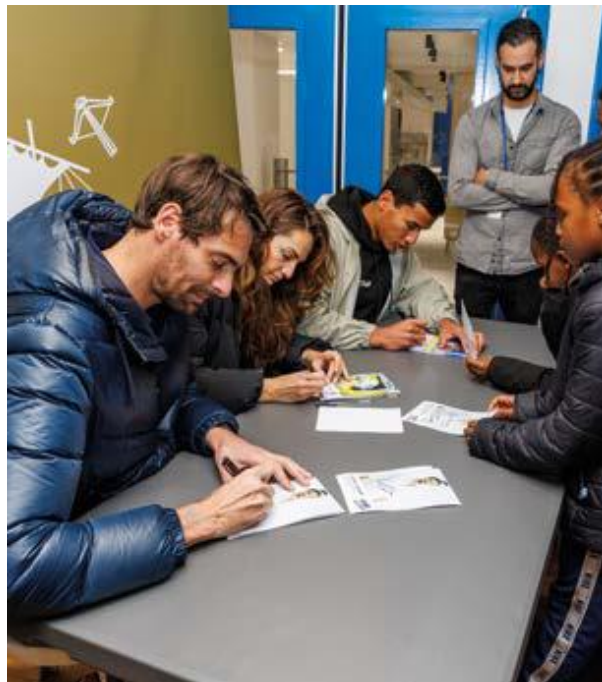
Figure 5 : Camille Lacourt en séance de dédicaces.

Les deux membres du Club étoiles 92, qui visent une qualification pour les Jeux de Paris l'été prochain, nagent une série en toute décontraction, complétant ainsi leurs 24 heures d'entraînement hebdomadaire. « La piscine de Villeneuve est vraiment un complexe original avec son bassin extérieur et intérieur. Je n'en ai vu qu'un autre en Europe à Barcelone », fait remarquer Béryl Gastaldello. La nageuse file sous la douche avant de rejoindre, quelques minutes plus tard, Camille Lacourt pour une séance d'autographes « J'ai commencé comme