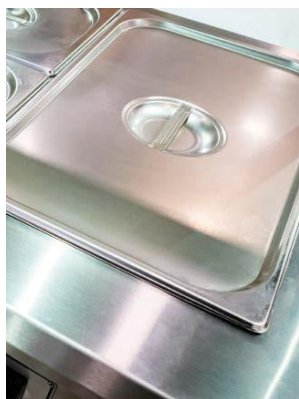
Figure 7 : La loi EGalim contraint à utiliser des contenants réemployables.