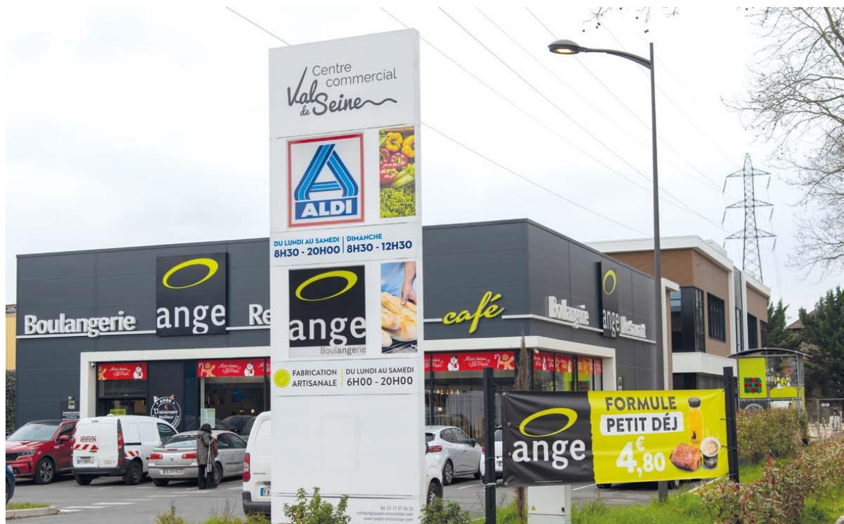
Figure 2 : L'ensemble de commerces et la maison de santé ont été créés pour redynamiser le quartier nord de Villeneuve.