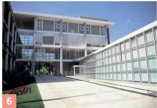
1. La première mairie de Villeneuve-la-Garenne en 1929. 2. Construction du nouvel Hôtel de ville derrière l'ancienne mairie en démolition à la fin de 1964. 3. Carte postale de l'Hôtel de ville en 1965 avec un parvis différent de l'actuel. 4. Vue depuis la Rotonde de l'arrière de l'Hôtel de ville durant les années 70, avant la construction du centre administratif. 5. Le côté ouest de l'Hôtel de ville vu depuis le parc en 1965. 6. Le « pont de cristal » reliant l'Hôtel de ville au centre administratif en 1995.