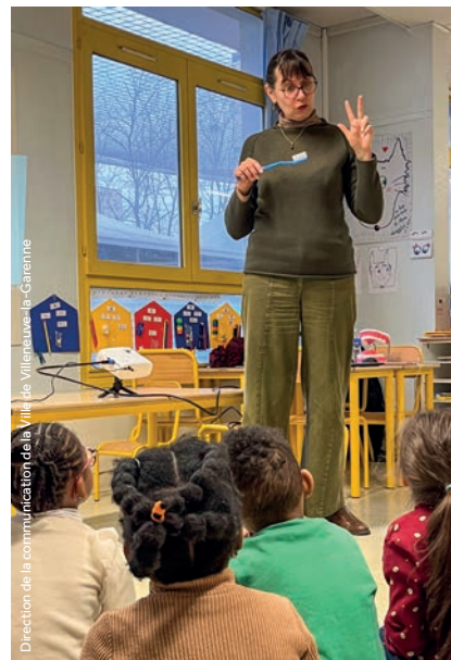
Direction de la communication de la Ville de Villeneuve-la-Garenne

des directeurs d'établissements et des enseignants qui ont souligné « son impact positif sur les élèves. »