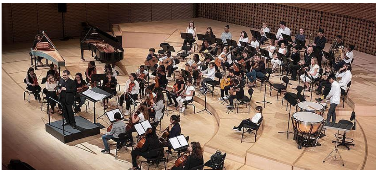
Orchestre des jeunes de Villeneuve-la-Garenne, La Seine Musicale, 92 Boulogne-Billancourt, 8 Juin 2019

Les intervenants artistiques travaillent  galement tout au long du projet avec des r f rents sociaux qui accompagnent dans leur quotidien les jeunes ainsi qu'au c ur des ateliers D mos.